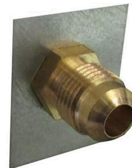
Propane Connection (3/8" Male Flare)