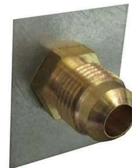
Propane Connection (3/8" Male Flare)